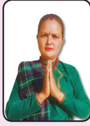
सुर्यमाली सिर्पाइली गाउँसभा सदस्य