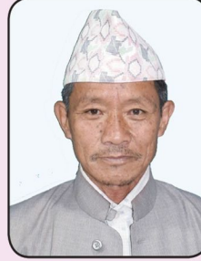
कविराज बुडा २ नं. वडा अध्यक्ष