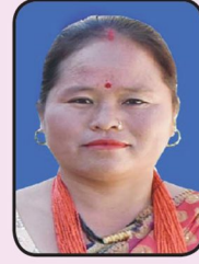
स्विर्मा बुढा गाउँसभा सदस्य