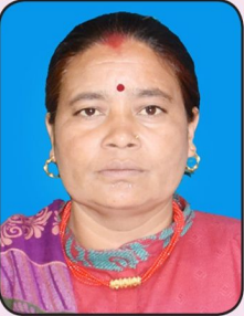
मोतिकला बि.क. कार्यपालिका सदस्य