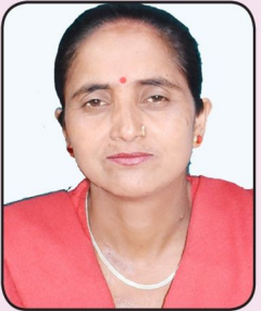
सम्खना तिरुवा कार्यपालिका सदस्य