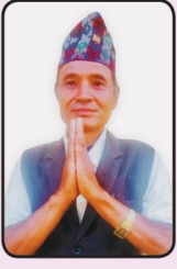
ओसे धर्तीमगर गाउँसभा सदस्य