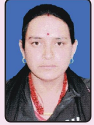
लिलसरा बि.क. गाउँसभा सदस्य